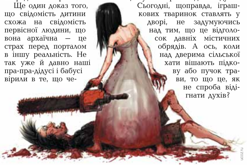
Шпальти підготували Людмила ЗАГЛАДА та Наталя ЧОМКО, «Освіта України»

рез вікна й двері в дім справді можуть проникнути злі духи, тому вважали за необхідне захищати ці місця за допомогою магичного захисту. Думаєте, візерунки на віконних рамах або фігурки тварин чи гномів біля дверей робили для краси? Ні, це були обереги від злих духів. Сьогодні, щоправда, іграшкових тваринок ставлять у дворі, не задумуючись над тим, що це відголосок давніх містичних обрядів. А ось, коли над дверима сільської хати вішають підкову або пучок трави, то що це, як не спроба відігнати духів?