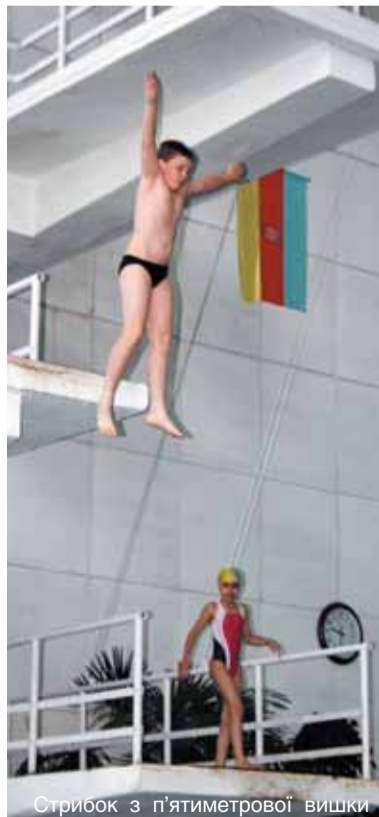
Стрибок з п'ятиметрової вишки

Тим часом у Палаці підводного спорту на тренування до